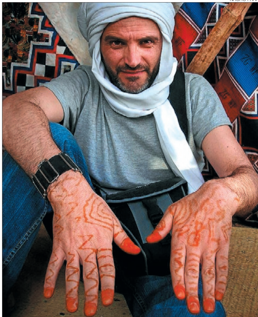
►► El actor Fernando Tejero, en una jaima del campamento de Dajla.

El Fishara ha conseguido en sus seis ediciones convertirse en el mejor recordatorio para la comunidad internacional. También para España: una comisión de actores está gestionando un encuentro con el presidente Zapatero para entregarle las 240.000 firmas recogidas en www.todosconelsahara.com , campaña lanzada el año pasado por Javier Bardem y a la que aún le queda un mes para cerrarse. ≡