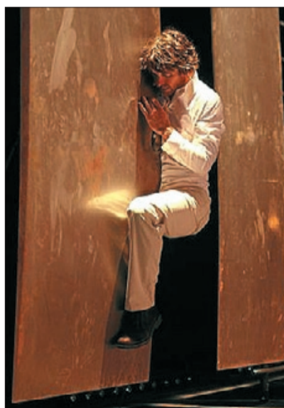
►► Una escena de Nieuwzwart .